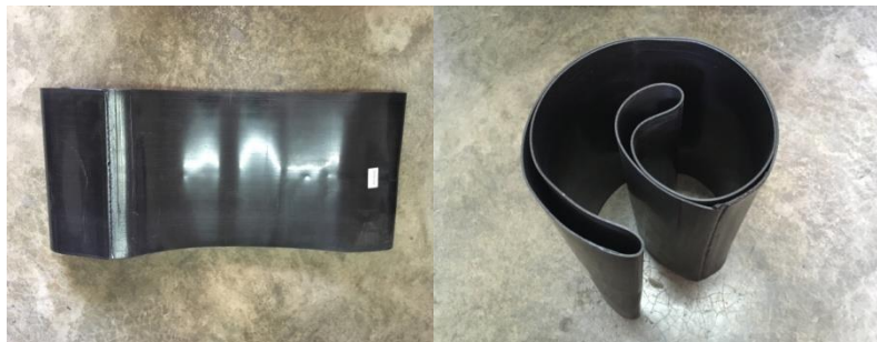
Hình ảnh đai ớp nhiệt